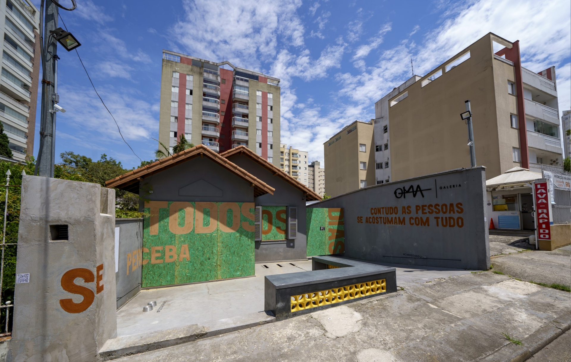
Ruína Imposta , 2020. Site specific para o 3º Edital OMA de Curadoria Da série (In) Rupturas . Tinta preparada com tijolos e tinta de terra coletados em demolições sobre tapumes e paredes. Dimensões variadas.