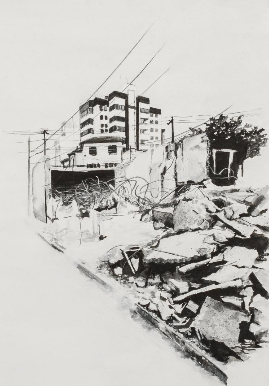
Antônio Frederico 147, 2015. Da série Lacunas da Memória . Tinta guache sobre papel. 35 x 27 cm.