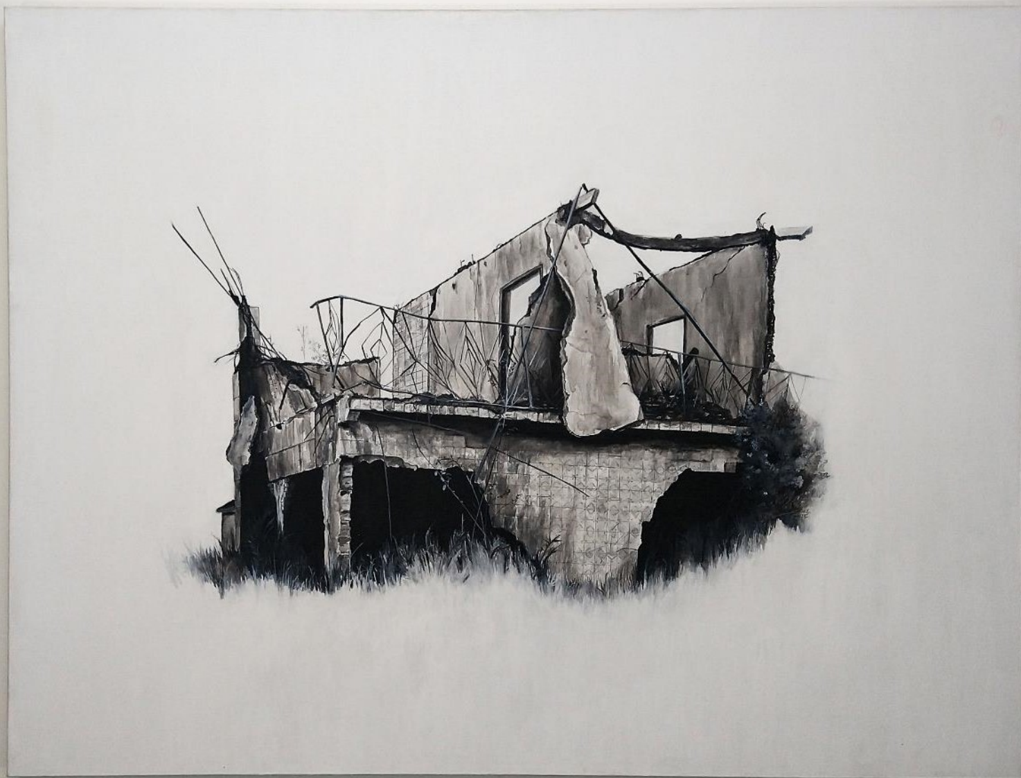
São Bento 221. 2018. Da série Marcas . Tinta guache sobre tela. 70 x 90 cm.