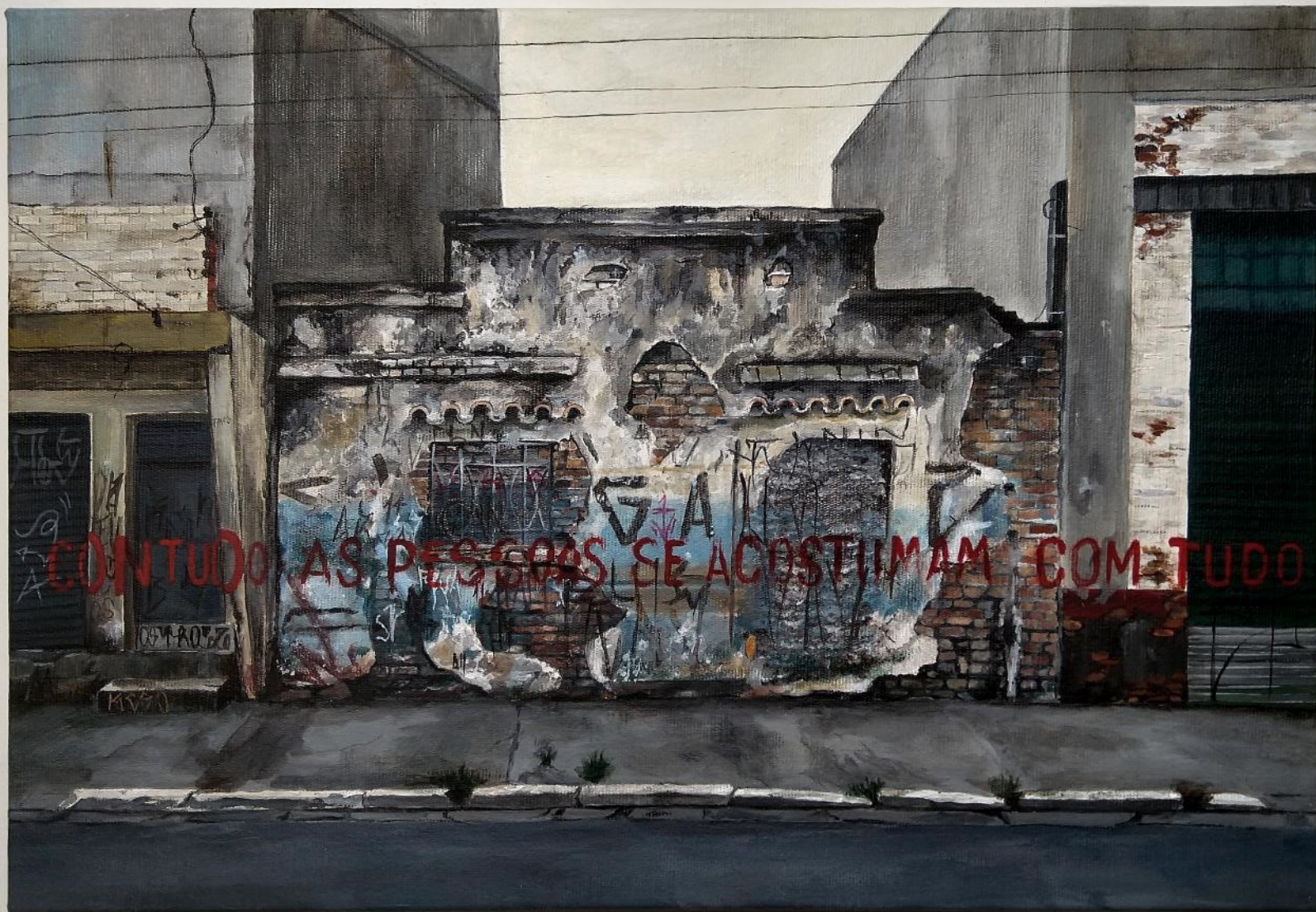
Contudo as pessoas se acostumam com tudo , 2020. Da série (In) Rupturas . Tinta acrílica s/ tela. 30 x 40 x 3 cm