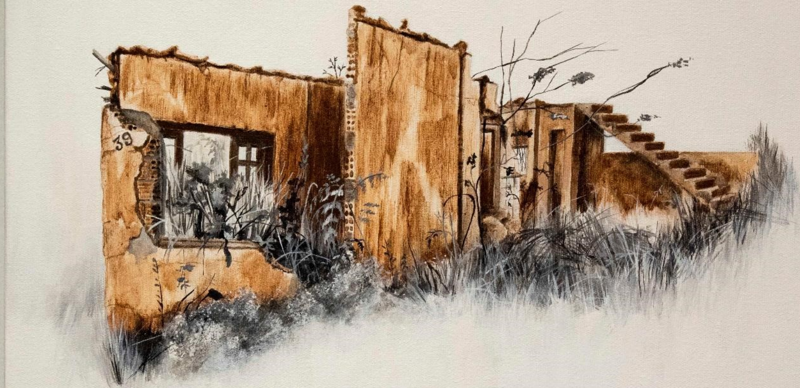
Álvaro Viana 39, | 2019.

Da série Marcas. Tinta preparada com rejeito de minério e tinta acrílica sobre tela 30 x 40 x 3 cm. Acervo do MAR – Museu de Arte do Rio.