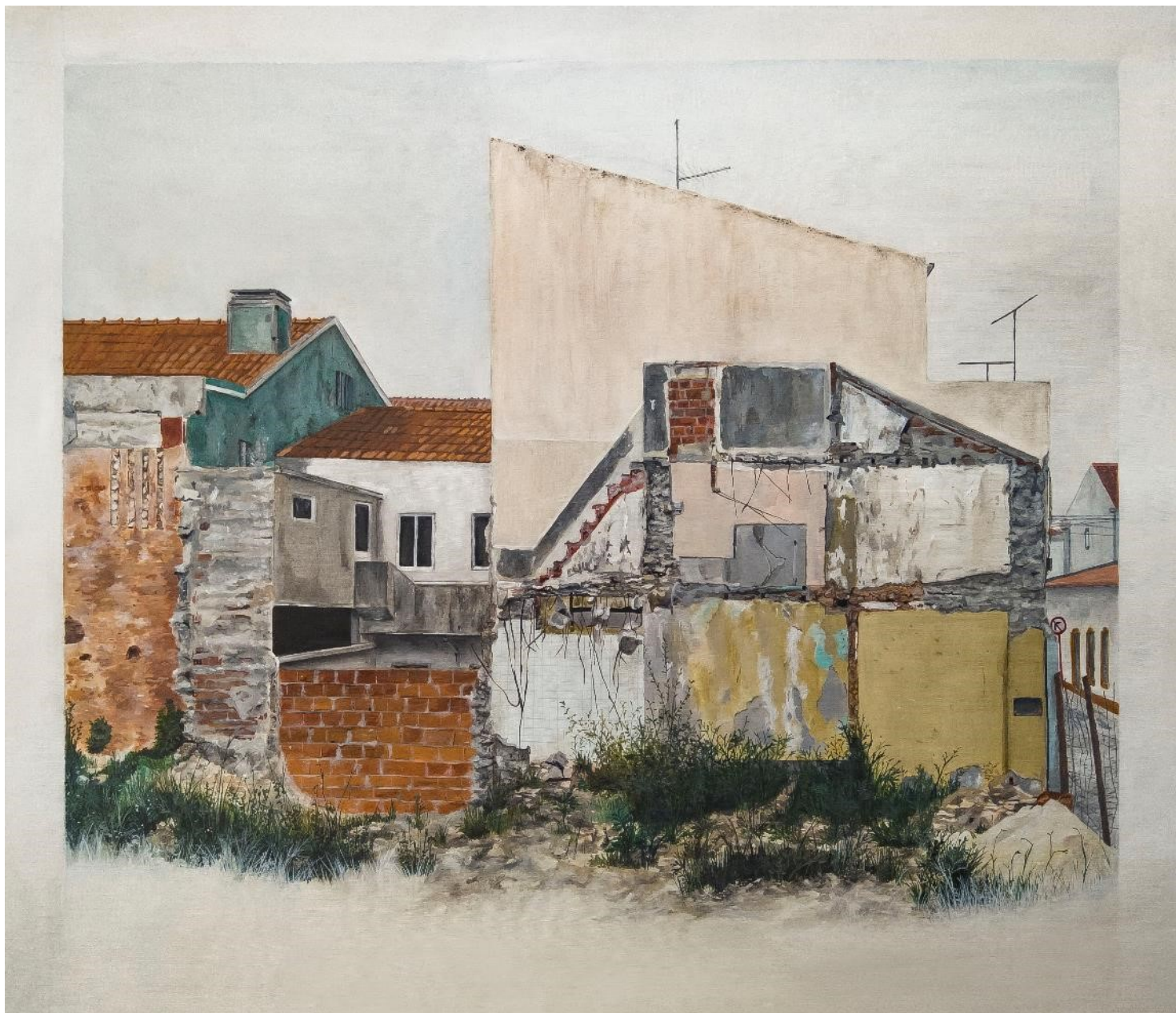
Marquês de Pombal 16 , 2020. Da série Lacunas da Memória . Tinta acrílica sobre tela. 64 x 70,5 cm.